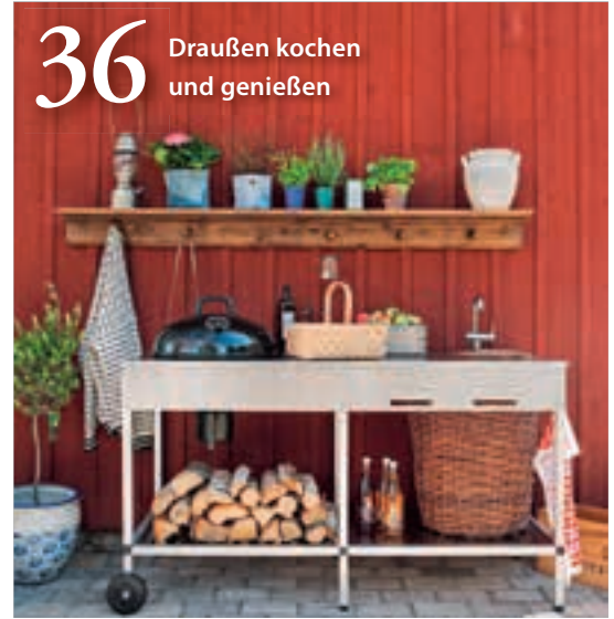
36 Draußen kochen und genießen