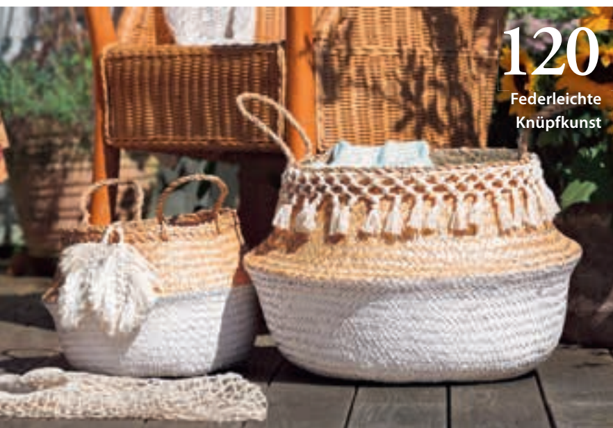
120 Federleichte Knüpfkunst