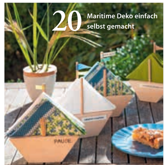
20 Maritime Deko einfach selbst gemacht