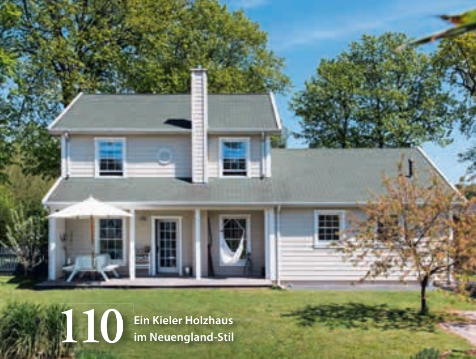
110 Ein Kieler Holzhaus im Neuengland-Stil