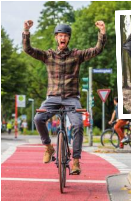
Der exklusive Fototermin mit Joko Winterscheidt hat Spaß gemacht – nicht nur ihm