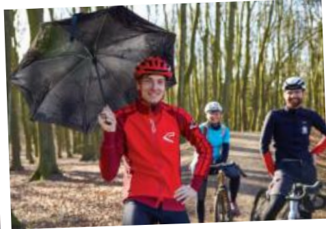
Ungerecht. Während die Kollegen auf Gravelbikes in ihren Größen fahren dürfen ...