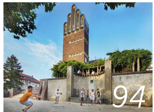
Darmstädter Ikone: Warum die Mathildenhöhe mit dem Hochzeitsturm weit über ihre Zeit hinausweist