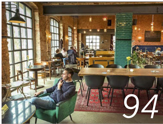
Der Charme der Industriekultur: das Restaurant »Kaiserbad« im Leipziger Westwerk

Die besten Food-Adressen in sechs Städten, wie hier bei »Kalinski« in Saarbrücken