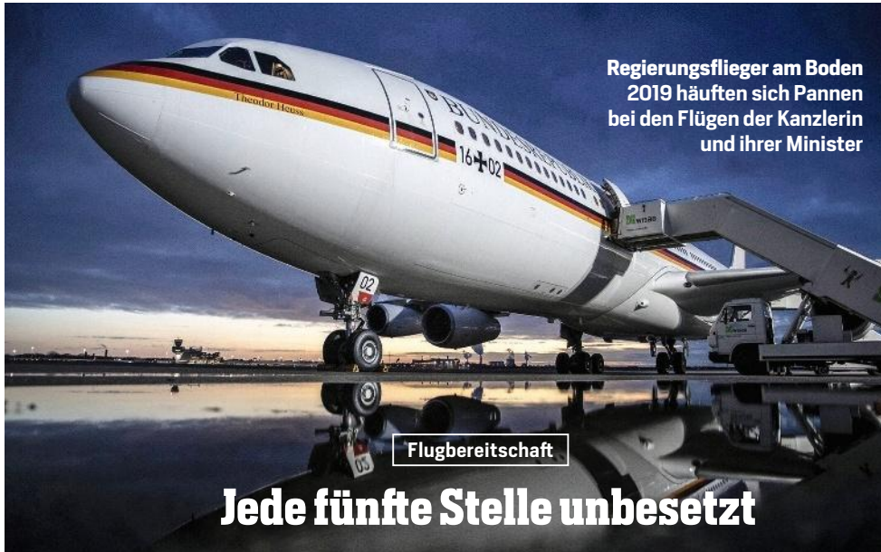
Regierungsfieger am Boden 2019 häuften sich Pannen bei den Flügen der Kanzlerin und ihrer Minister