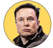
Elon Musk, 48 Vorstandschef von Tesla

Palo Alto Elon Musk hält sein Versprechen. Tesla lieferte im zweiten Quartal 95 200 Elektroautos aus, mehr als je zuvor. Es ist ein überraschender Erfolg für Musk, der nach Produktionsproblemen zuletzt immer wieder in der Kritik stand. Die Tesla-Aktie legte um sieben Prozent zu.