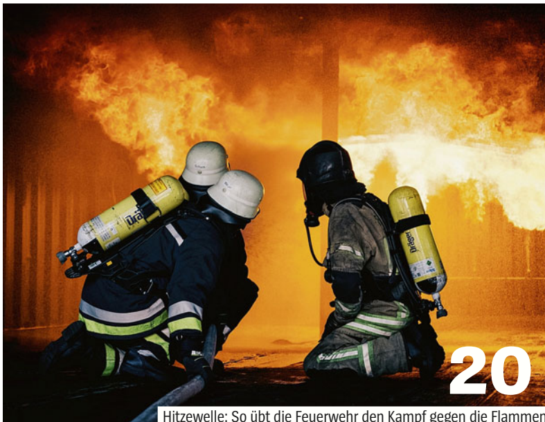
20 Hitzewelle: So übt die Feuerwehr den Kampf gegen die Flammen