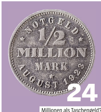
24 Millionen als Taschengeld?