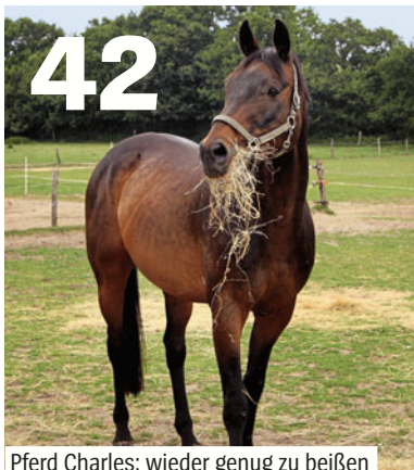
42 Pferd Charles: wieder genug zu beißen