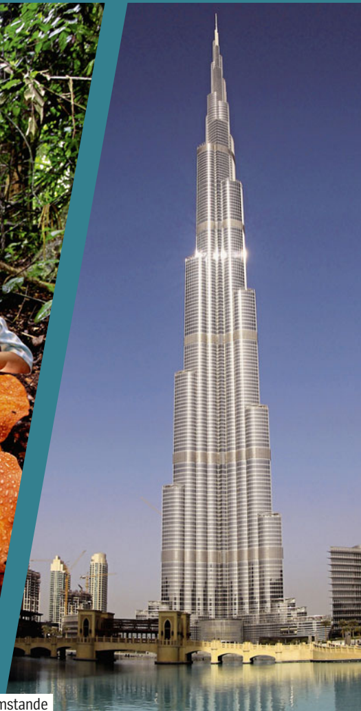
Die Schnellste, die Größte, das Höchste: Mensch und Natur sind zu beeindruckenden Höchstleistungen imstande