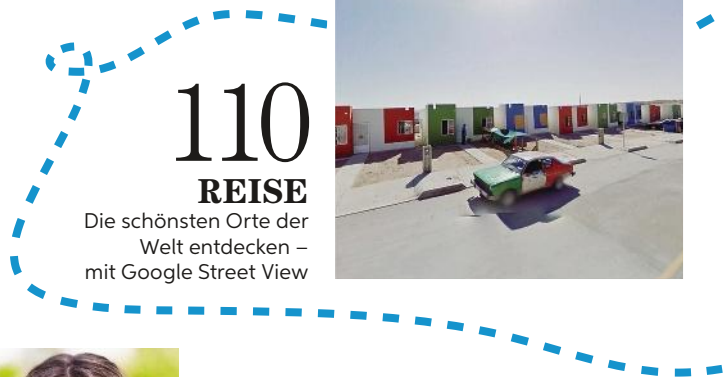
110 REISE Die schönsten Orte der Welt entdecken – mit Google Street View