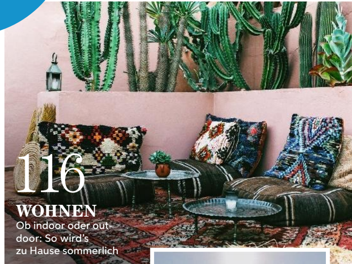
116 WOHNEN Ob indoor oder outdoor: So wird's zu Hause sommerlich