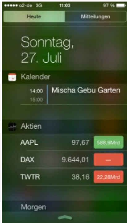
Abbildung 1.1 : Die Mitteilungszentrale in iOS 8