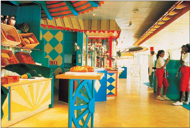
038fr Abb.: si

▲ Auf dem Clubschiff Aida geht es nicht so förmlich zu wie auf anderen Kreuzfahrtschiffen