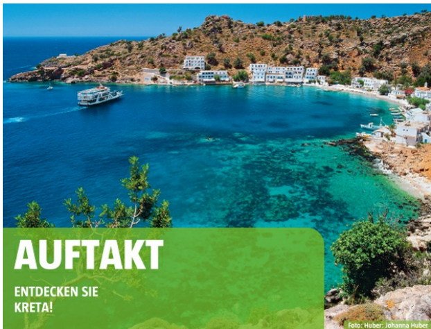
Bild: Küstenort Loutró nahe Chaniá

Kreta ist eine Welt für sich. Griechenlands größte Insel ragt wie ein Hochgebirge mit fast 2500 m hohen Gipfeln aus dem Meer. Hier findet fast jeder, was er sucht: lange Sandstrände und einsame Buchten, nächtliches Highlife und die Stille wilder