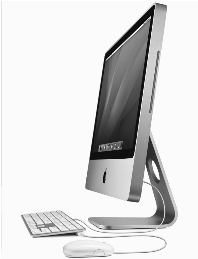
Abb. 1.2 Alles drin, alles dran – das Design eines iMac ist minimalistisch attraktiv und Apple-typisch.

Auf die Spitze getrieben hat Apple die schlanke Designlinie mit dem MacBook Air. Dabei handelt es sich um ein extrem flaches und extrem leichtes Notebook, das sogar in einen handelsüblichen Großbriefumschlag passt. Und das, obwohl es mit einem 13,3-Zoll-Breitformatbildschirm und einer normal großen Tastatur ausgestattet ist. Was allerdings fehlt, ist ein internes Laufwerk. Das MacBook Air kommuniziert mit anderen Geräten über eine schnelle Funk- oder Kabelverbindung. Auch ein externes DVD-Brennlaufwerk kann über ein USB-Kabel angeschlossen werden.