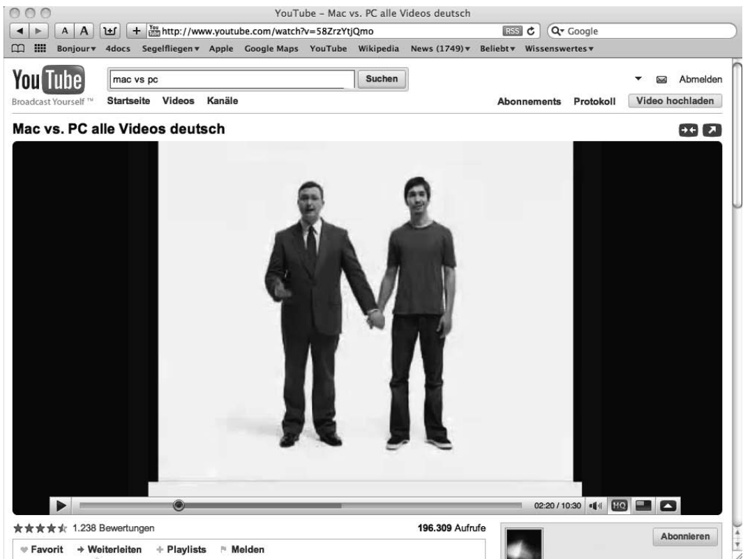
Abb. 1.1 So stellen sich PC (links) und Mac (rechts) in den Augen der Apple-Werbung dar.

So sehen die typischen Eigenschaften von Mac und PC aus, die in den äußerst gelungenen Apple-Werbespots „Mac vs. PC“ geschickt dargestellt werden. Was dort zu sehen ist, entspricht den gängigen Klischees und macht die Werbebotschaft dadurch umso wirksamer.