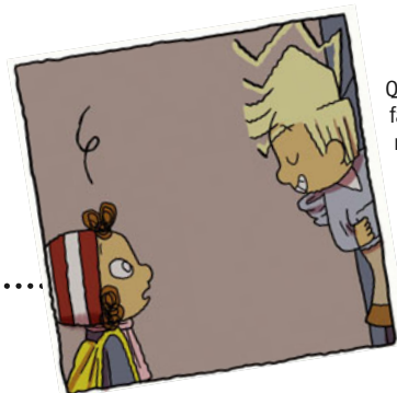
Q-R-T auf Klassenfahrt: Los geht es mit einer aufregenden Tour im Bus.