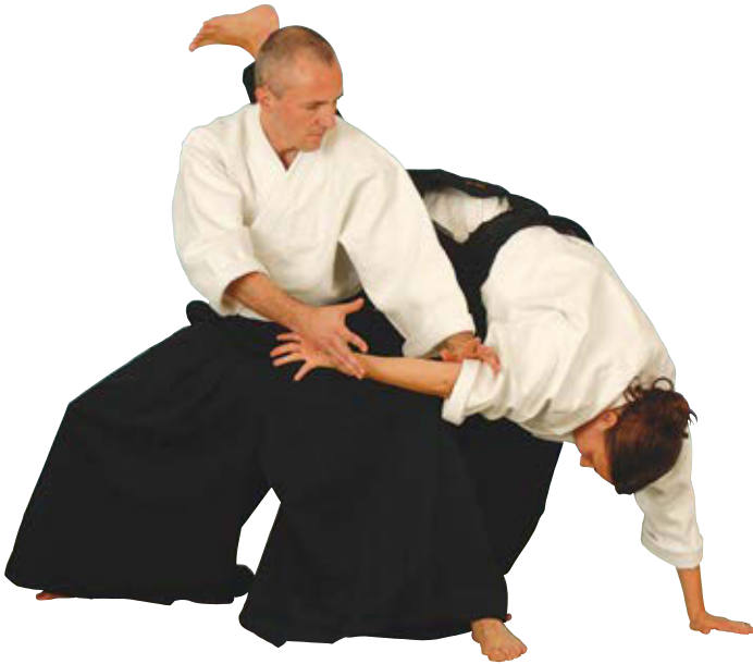
ikkyo omote waza